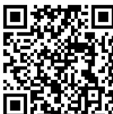
Dieter C. Rangol